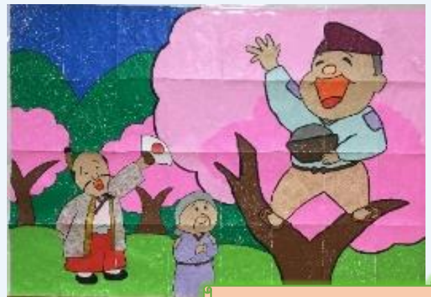
作品名：「花嫁かじいさん」