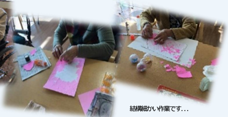
結構細かい作業です...