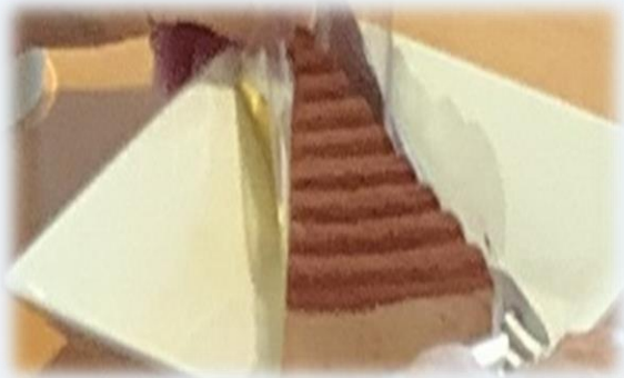
チョコレートケーキ♪